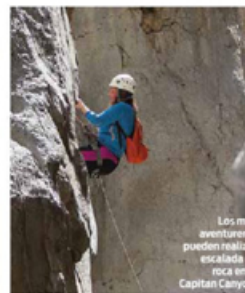
Los más aventureros pueden realizar escalada en roca en el Capitán Canyon.

Pero las maravillas naturales no terminan ahí, a las afueras de Page está el Hlooshoh Bend, punto donde el Río Colorado forma una herradura de 300 metros de profundidad.