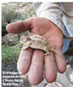
Es el hogar de especies de flora y fauna dignas de admirar.

Busy, uno de los capitanes de la embarcación asegura que no hay mujer en el mundo que lo pueda sacar de ese lugar, su pasión es la pesca y puede dedicar días enteros a ello.