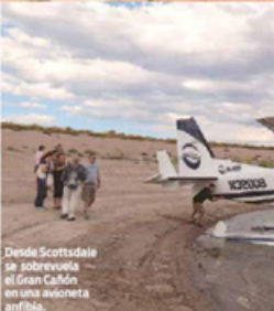
Desde Scottsdale se sobrevuela el Gran Cañón en una avioneta anfibia.

Desde un pequeño aeropuerto se llega a un hangar privado donde se organizan estas excursiones. Desert Splash Sea Plane Adventure es la compañía que organiza el recorrido por el Apache Trail Camino Apache que lleva hasta el Lago Roosevelt donde acuatiza la avioneta.