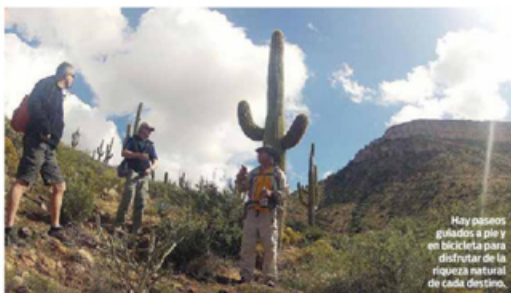
Hay paseos guiados a pie y en bicicleta para disfrutar de la riqueza natural de cada destino.

FORALICIA BOY ENVIADA foyaliciboy@gmail.com.mx