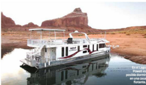
En el Lago Powell es posible dormir en una casa flotante.

En Page, el poblado más cercano, es posible contratar los servicios de guía para explorar, a bordo de una Hummer, el desierto y llegar a cañones similares al famoso Antelope Valley.